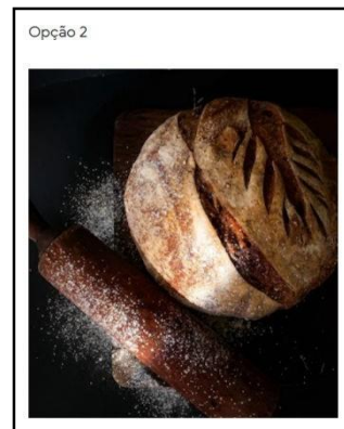
Imagem 2: opção com edição fotográfica.